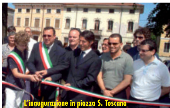
L'inaugurazione in piazza S. Toscana

È stato calcolato che una famiglia può risparmiare circa 200/300 Euro l'anno: sono soldi che di fatto l'amministrazione comunale mette nelle tasche dei suoi cittadini grazie ad un consumo intelligente di questo bene primario.