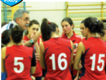
La seconda Divisione

L'Under 18 maschile punta alla finale di Dossobuono