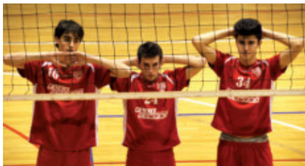
La Under 18 maschile