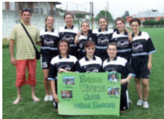
1° classificata femminile

Un plauso sincero a tutti quelli che in ruoli diversi hanno a vario titolo contribuito alla buona riuscita della manifestazione. "Una manifestazione" come ha rilevato